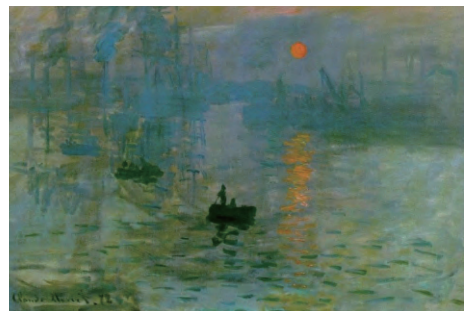
클로드 모네 『인상, 일출』, (1873)

‘빛’은 눈에 잘 보이지 않지만, 많은 화가들의 예술 원천이었어요. 빛과 함께 달라지는 자연의 변화를 포착하여 캔버스에 빛을 그린 화가 ‘클로드 모네’의 작품에서도 볼 수 있지요. 우리 아이들도 자신만의 시선을 담아 빛을 탐구하도록 가정에서도 예술 환경을 조성해 보세요.